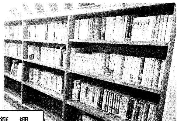
譲 渡 書 籍 棚